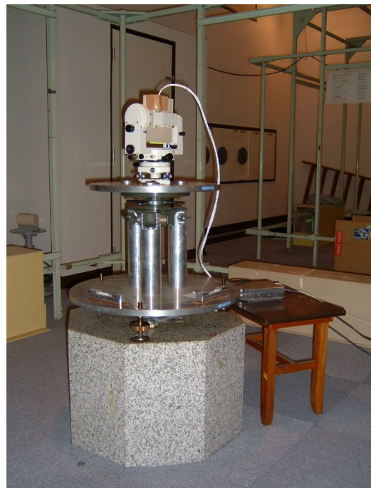
<写真1 : S-310-38号機搭載の磁力計を地磁気観測所の比較較正室で較正している様子。白いケーブルの先にある白い直方体がセンサ、右下の木の台の上の銀色の直方体が回路部。>

自然界の磁場を測定する方式の一つとして、観測ロケットに磁力計を搭載して飛行中の磁場を測るものがあります。観測ロケットとは、ロケットの頭の部分に観測機器を載せ、飛行している間の観測を行い、データを地上局に送信する大掛かりな実験です。到達高度はロケットの種類によって異なり、搭載するものの重量によっても変わりますが、百数十キロメートルから数百キロメートルくらいです。日本では鹿児島県肝付町に宇宙航空研究開発機構の射場が、海外でもアラスカやカナダ、ノルウェー、スウェーデンなどに射場があり実験が行われています。特定の現象（例えばパルセーティングオーロラ、スポラディックE層など）の観測を目標とする時には、その現象が出現するまで忍耐強く待機する必要に迫られるのも観測ロケット実験の特徴です。