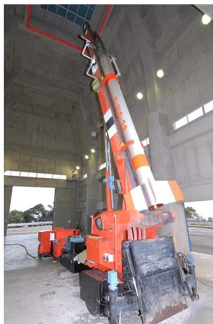
<写真3：打ち上げ前のS-310-38号機。打ち上げの時には、この建屋の天井（赤い枠）が開き、ロケットはそこを通過して上昇する。>